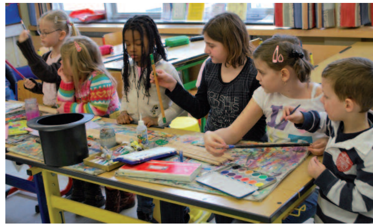
Kindergartenkinder beim Schulbesuch im Rahmen eines Kooperationsprojektes